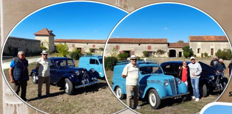
Les voitures de collection et leurs propriétaires