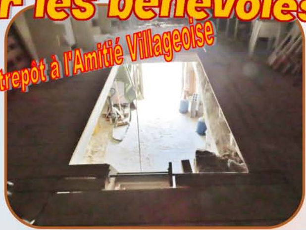
Travaux dans le local communal servant d'entrepôt à l'Amitié Villageoise

Les bénévoles de l'Amitié Villageoise ont entrepris des travaux pour ranger le matériel du comité des fêtes y compris l'aménagement du grenier. La commune a prévu d'y installer un compteur électrique.