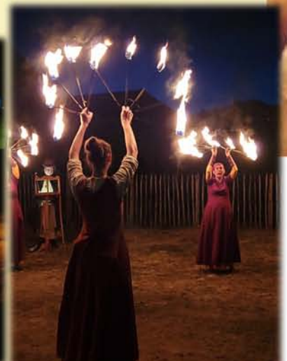
Spectacle de feu réalisé par « les traditions médiévales » de St Martin de Bernegoue