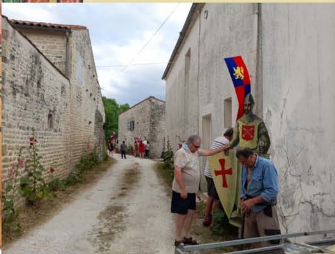
Installation des fanions et des chevaliers