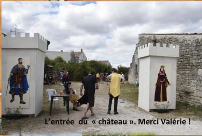
L'entrée du « château ». Merci Valérie !