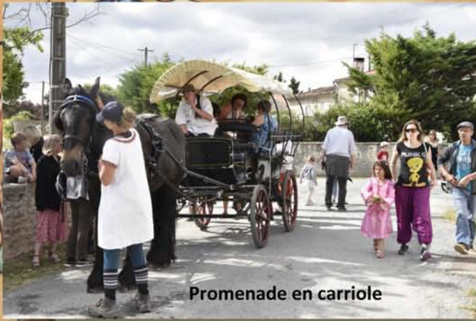
Promenade en carriole