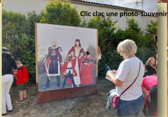
Clic clac une photo-souvenir