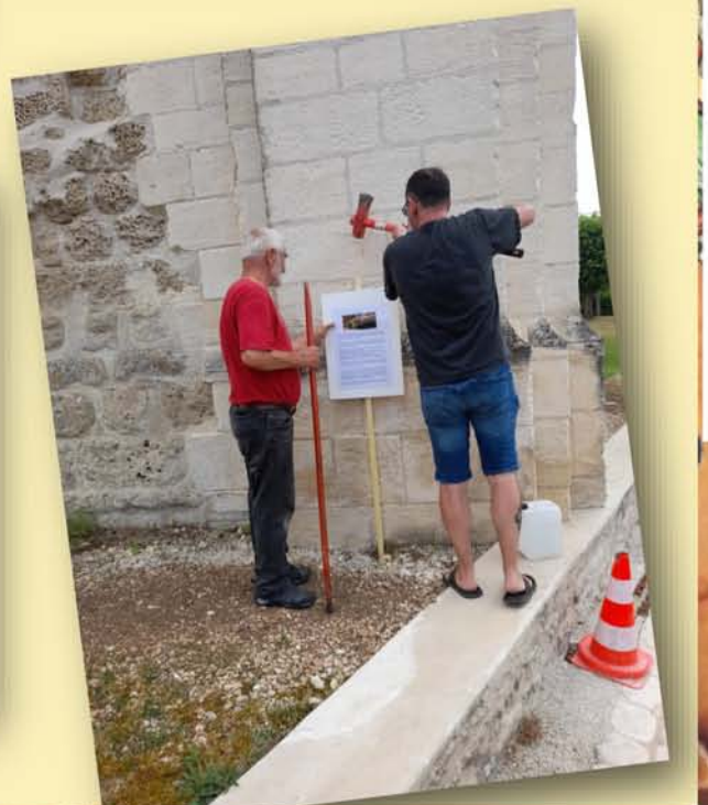
Pose des panneaux signalant les monuments 18