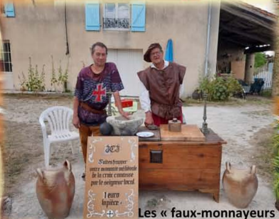
Les « faux-monnayeurs »