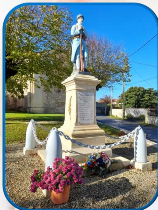
Merci aux personnes qui ont déposé un chrysanthème au pied du monument aux morts