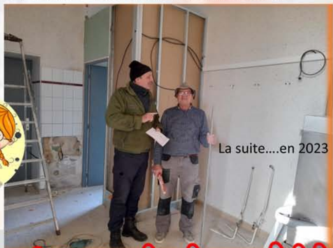
La suite...en 2023