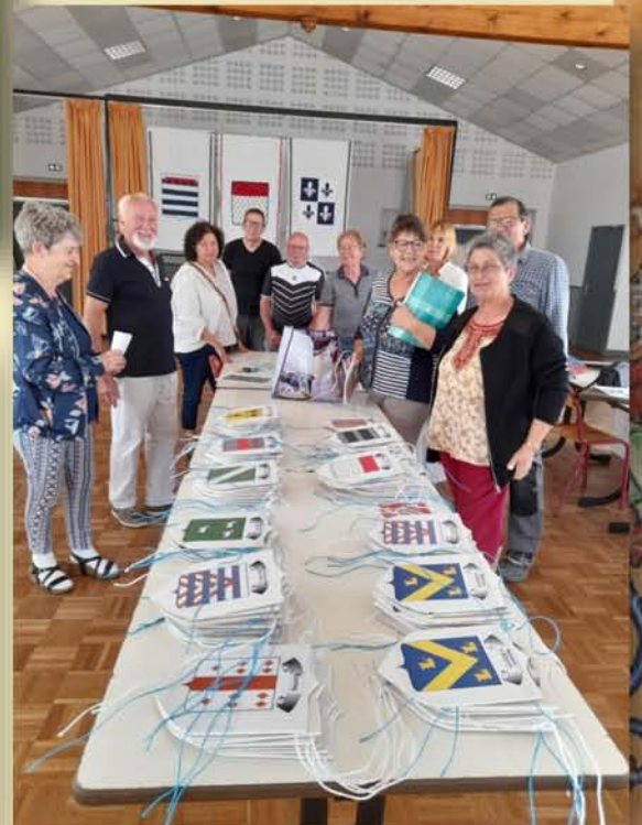
Fabrication des costumes, des blasons