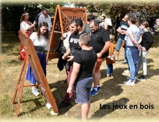
Les jeux en bois