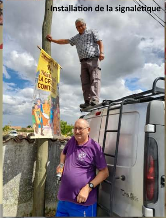
Installation de la signalétique