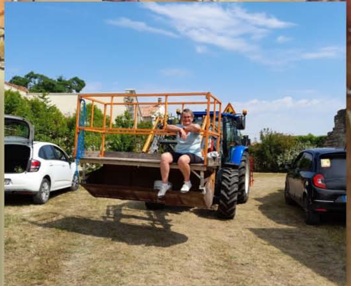
Départ pour la mise en place des fanions dans les rues