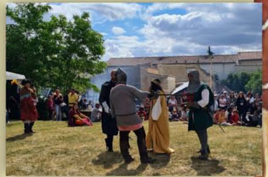
La « princesse » est délivrée