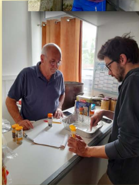
Préparation de l'Hypocras