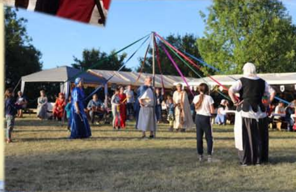
Combats et danses sur la motte