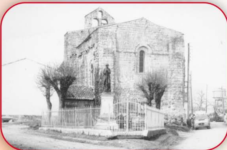
Le monument aux morts et sa grille en 1964 - 1965