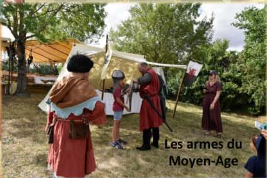
Les armes du Moyen-Age