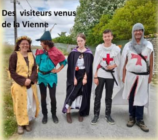
Des visiteurs venus de la Vienne