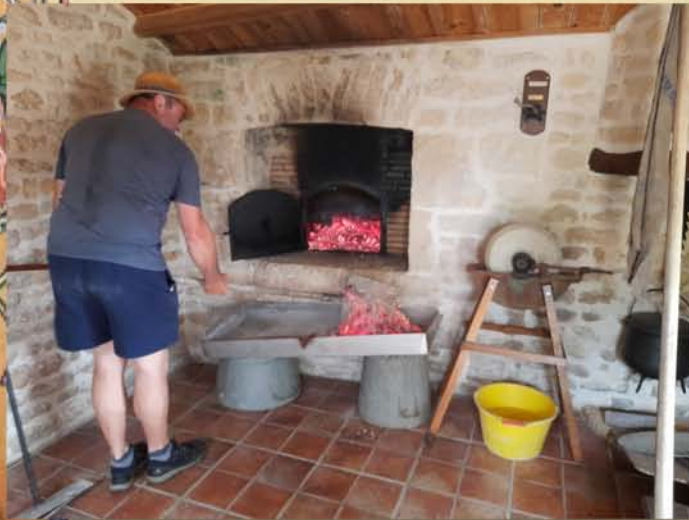
Le four à pain bientôt opérationnel