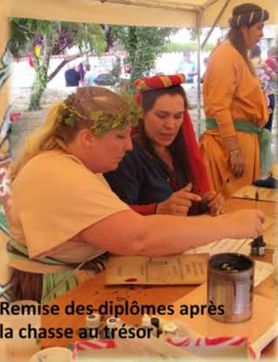
Remise des diplômes après la chasse au trésor