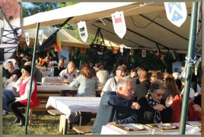
Le banquet festif