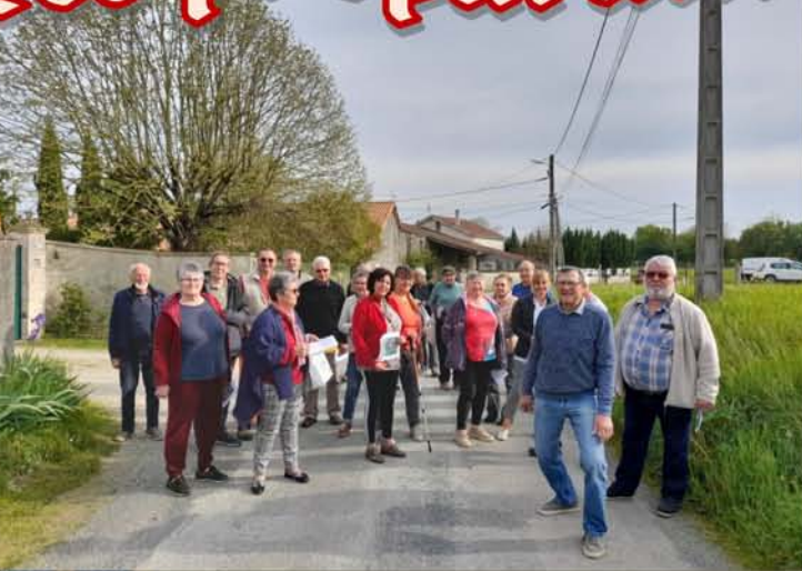
Repérage du parcours de déambulation