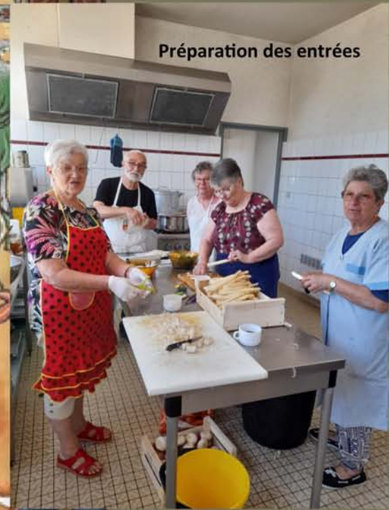
Préparation des entrées