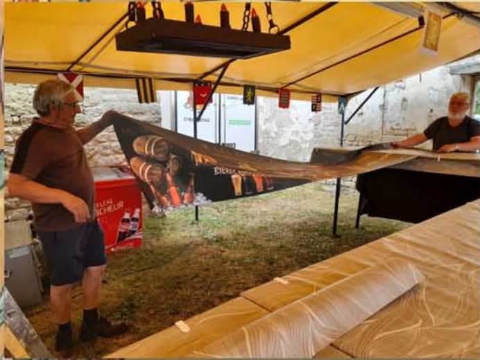
Installation du bar