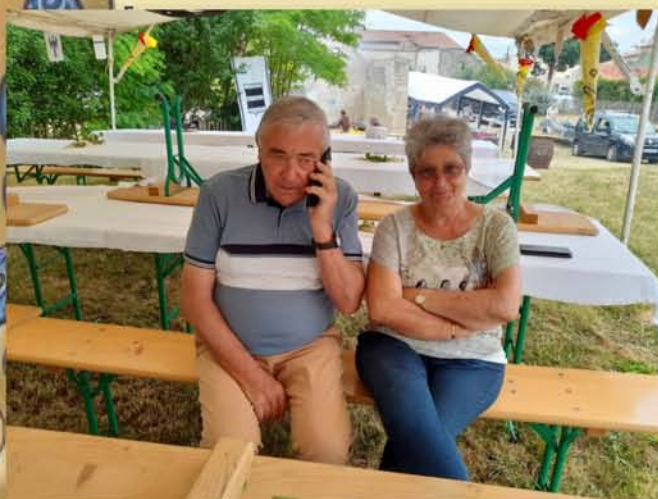
Interview de France Bleu La Rochelle le matin de la fête