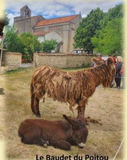
Le Baudet du Poitou