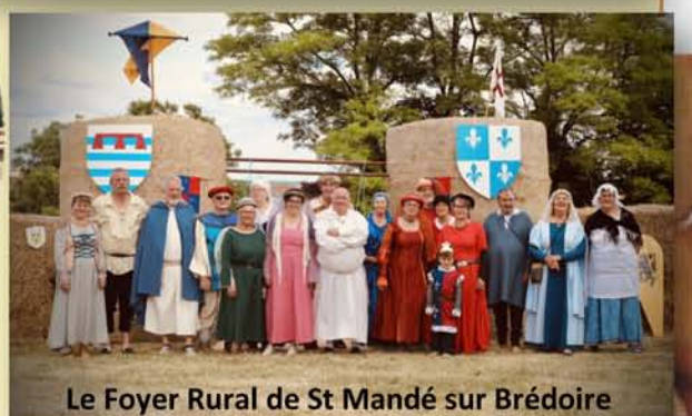
Le Foyer Rural de St Mandé sur Brédoire