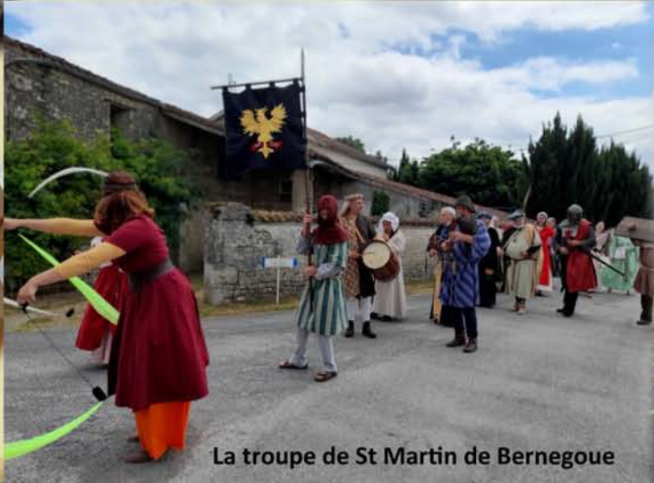
La troupe de St Martin de Bernegoue