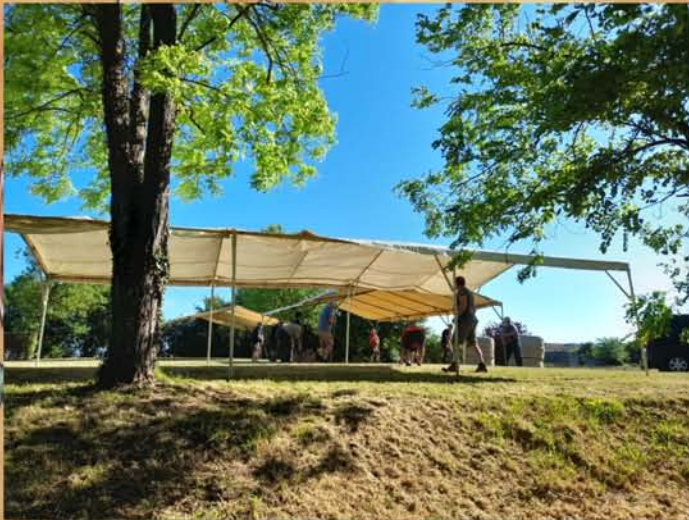
Mise en place des tivolis sur la motte et le réconfort après l'effort