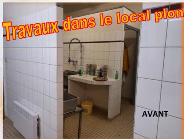
Travaux dans le local plonge de la salle communale

Les bénévoles de l'Amitié Villageoise ont entrepris des travaux pour ranger le matériel du comité des fêtes y compris l'aménagement du grenier. La commune a prévu d'y installer un compteur électrique.