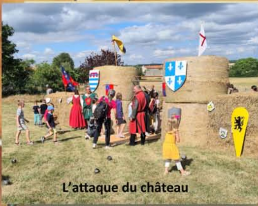
L'attaque du château