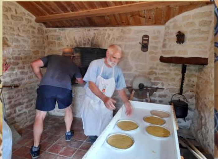
Cuisson des gâteaux