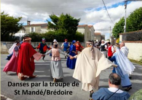
Danses par la troupe de St Mandé/Brédoire