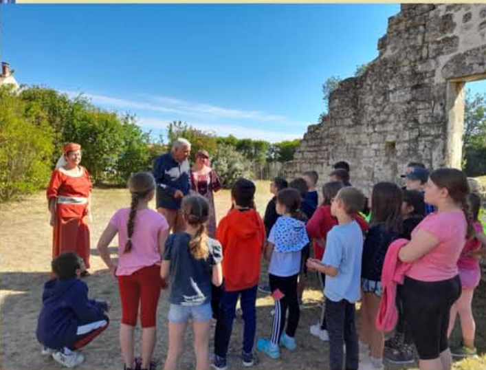
Accueil des élèves de l'école primaire de Loulay par le Maire