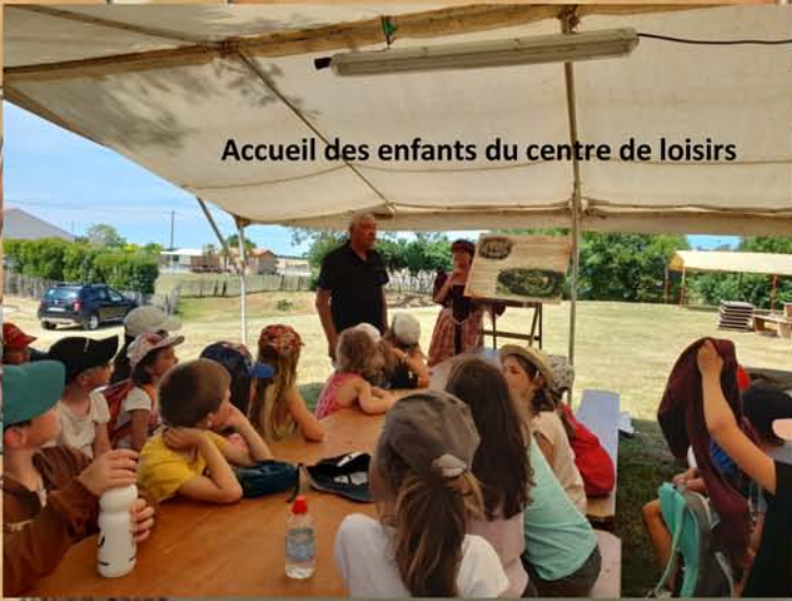
Accueil des enfants du centre de loisirs