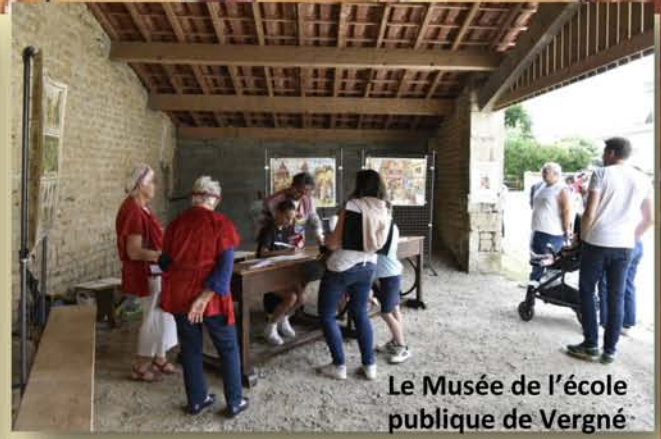
Le Musée de l'école publique de Vergné