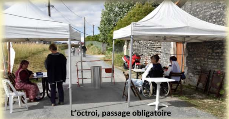
L'octroi, passage obligatoire