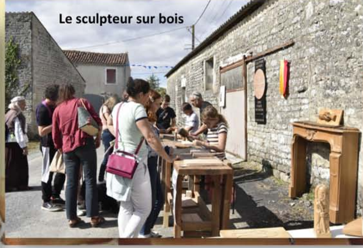
Le sculpteur sur bois