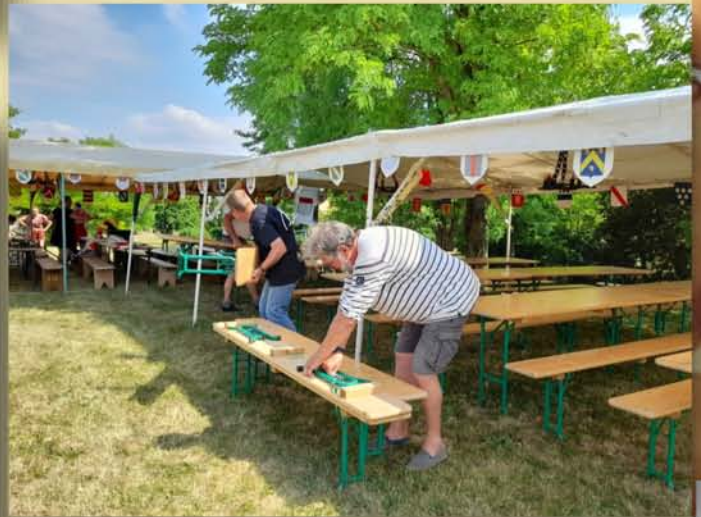
Installation des bancs et finitions sous les tivois