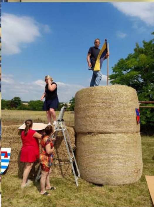
Mise en place du château