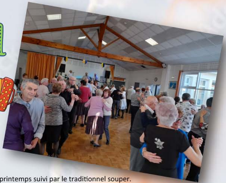
Le rendez-vous dansant du printemps suivi par le traditionnel souper.