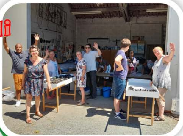
Encore un succès pour ce 45ème méchoui (depuis 1977, il en manque un, de la faute au Covid)